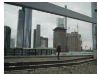
Master of the Universe

Stationen zu den Filmen in den Wettbewerbsprogrammen Dokumentarfilm und im nationalen Programm wurden von den Mitgliedern der Auswahlkommission geschrieben. Alle Zitate in den Katalogtexten zu DOK Leipzig 2013 müssen als solche gekennzeichnet werden. Der Name der Autorin bzw. des Autors muss dabei angegeben werden. Alle anderen nicht namentlich gekennzeichneten Beiträge sind Produktionsmitteilungen.