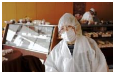
Beyond the Wave